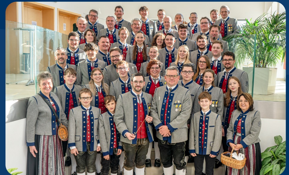
Trachtenkapelle Erlauf (Österreich)