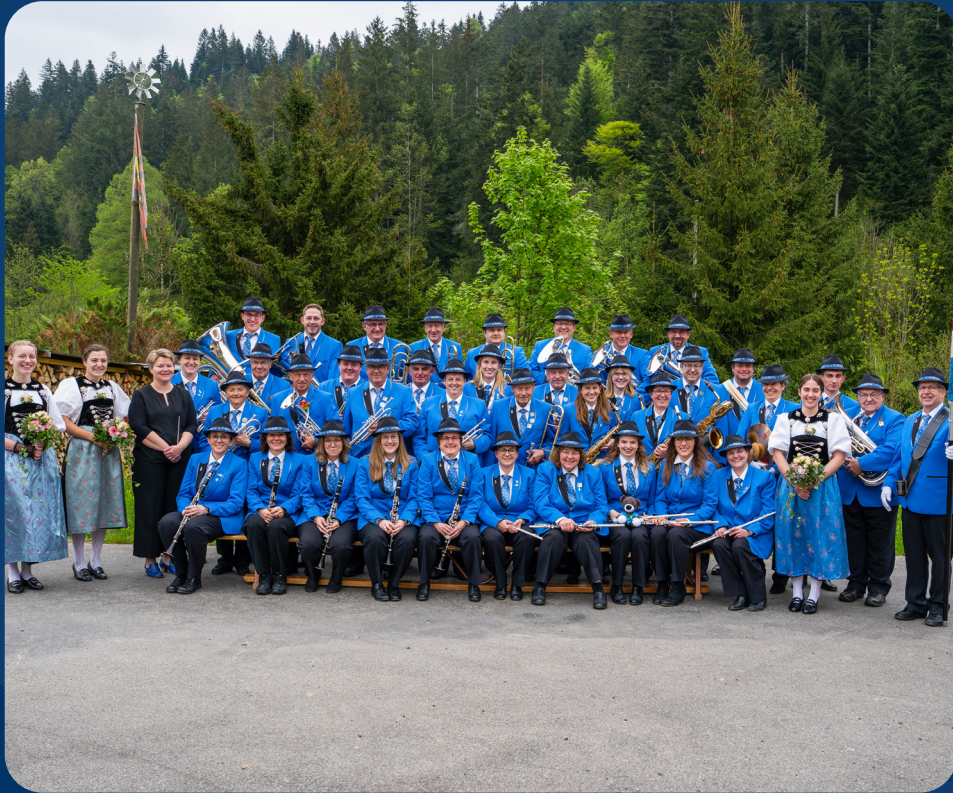
Ihre Gastgeber (Musikgesellschaft Zollbrück)