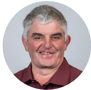
Bärtschi Res Ressort Verkehr/Sicherheit